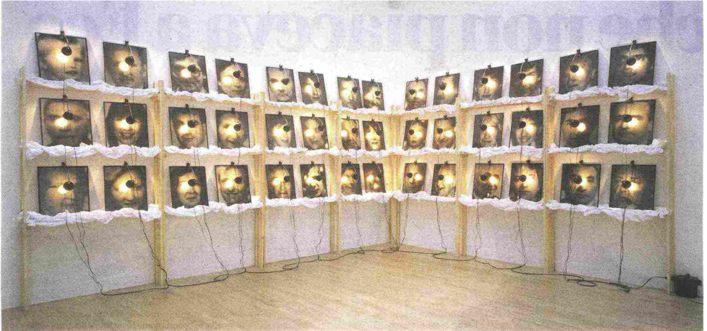
Christian Boltanski, The Reserve of Dead Swiss , 1990, Londra, Tate

nella storia della Shoah è il tema del convegno che il prossimo 5 febbraio si svolgerà nel Museo dell'Arte Classica-Odeion, alla Sapienza di Roma, dalle 14,30. Nell'occasione verrà inaugurata la mostra Medicina e Shoah. Dalle sperimentazioni naziste alla bioetica